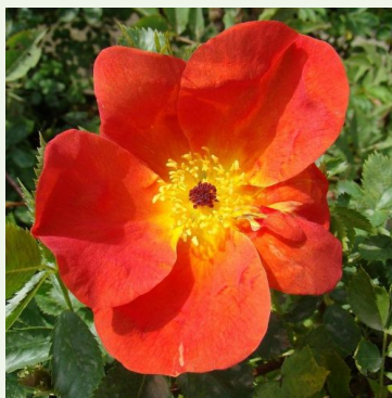
Rosa foetida bicolor

jaune - églantier 160-240 cm rose au parfum moyen, bien perceptible - arôme typiquement épicé -