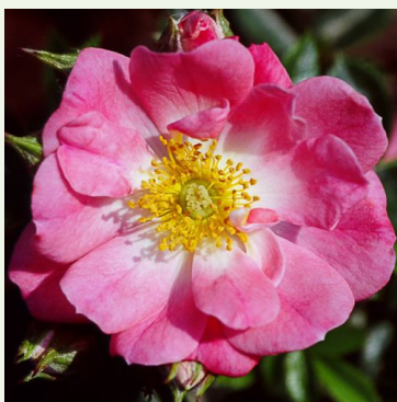
Rosa moyesii 'Eos'

blanc - rosier buissonnant paysager 150-200 cm rose au parfum puissant, à tenue longue - description olfactive non disponible -