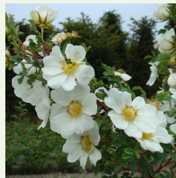
Rosa kokanica Vacratot

orange - rosier paysager 150-250 cm rose au parfum puissant, bien perceptible - riche, légèrement sucré-épicé, légèrement réglissé-anisé -